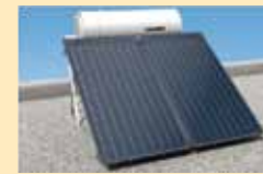
Para tejado plano