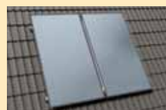
Sobre tejado inclinado

Los captadores solares y equipos termosifón Junkers se pueden instalar en tejados planos o inclinados. Las estructuras son fabricadas totalmente en aluminio.