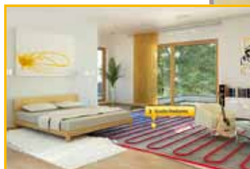
La energía solar térmica genera agua caliente para el hogar y da apoyo a sistemas de calefacción como suelo radiante.