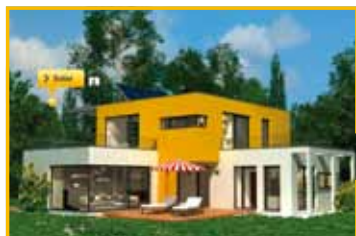
Los sistemas solares térmicos de Junkers se pueden utilizar en casas unifamiliares y en otros tipos de edificios.