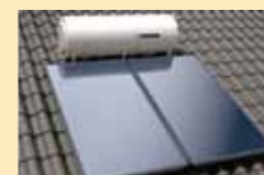
Para tejado inclinado