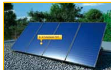
Los captadores solares de Junkers se adaptan a cualquier tipo de tejado.