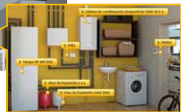
Los sistemas solares se pueden combinar con diferentes tecnologías para apoyo en la producción de calefacción como las bombas de calor.